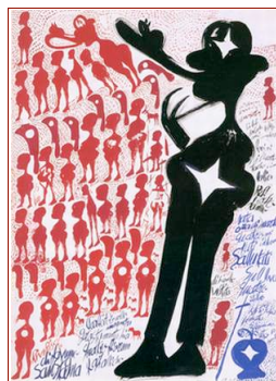
C. Zinelli, Senza titolo, s.d.

1959-2009. La mia storia tra arte e follia.